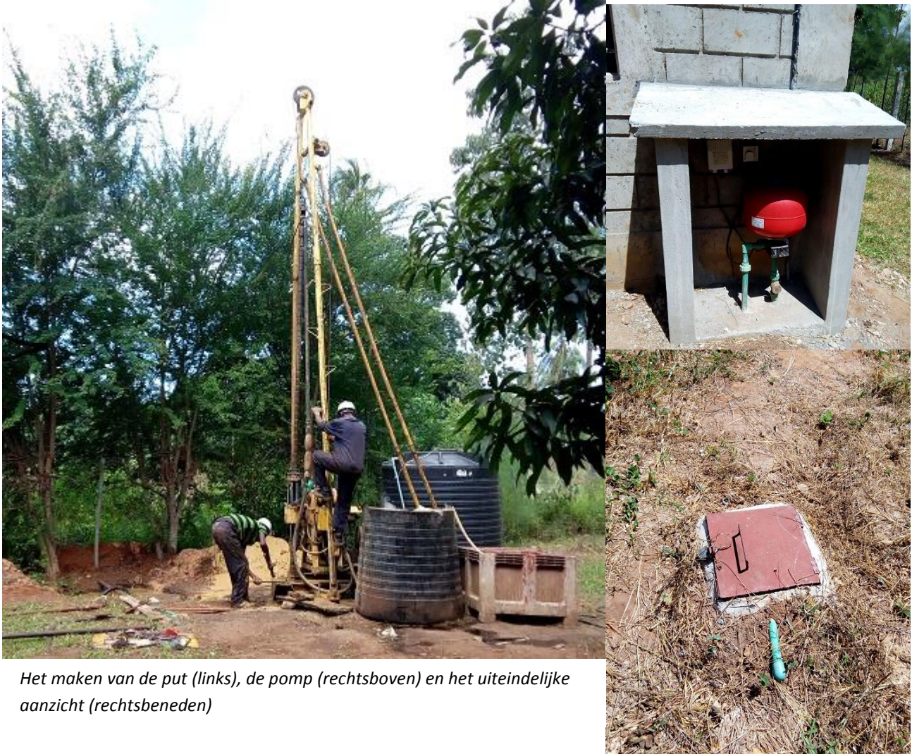
Het maken van de put (links), de pomp (rechtsboven) en het uiteindelijke aanzicht (rechtsbeneden)

niet werkt. Iets wat zeer regelmatig het geval was, soms duurde het zelfs één tot twee weken voordat er weer water uit de kraan kwam. Onze 30.000 liter opslag was weliswaar voldoende voor de standaard waterrantsoenering (meestal krijgt de college twee of drie dagen per week water), maar niet voor langere periodes. Met meer dan 300 studenten waarvan er ook nog eens een groot deel intern zitten, was dat elke keer weer crisis. Met de verkregen donaties en met het geld dat de school zelf opzij kon zetten, is het gelukt een “borehole” te graven, een diepe (70 meter), relatief dunne pijp (doorsnede 15 cm) die met behulp van een