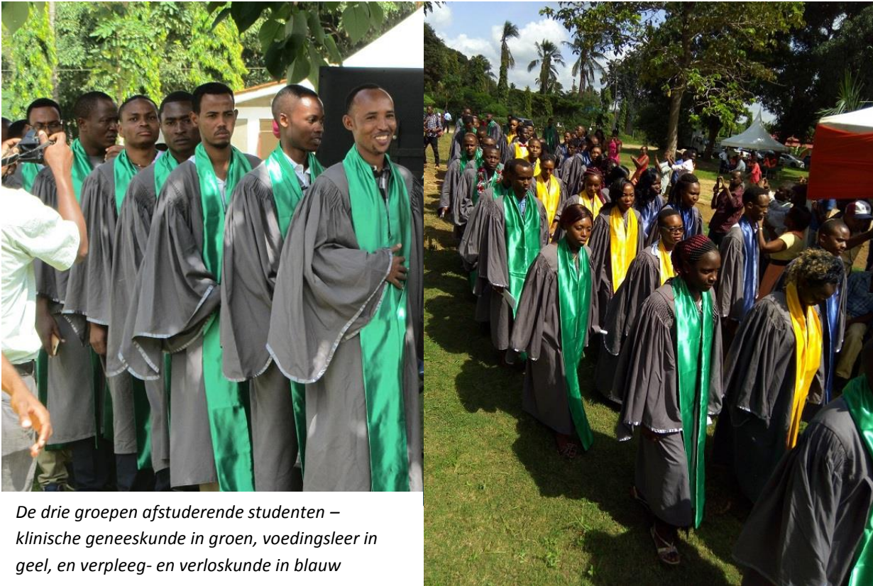
De drie groepen afstuderende studenten – klinische geneeskunde in groen, voedingsleer in geel, en verpleeg- en verloskunde in blauw

allemaal in de herkansing. Naast deze drie opleidingen, waar we in 2012 en 2013 mee begonnen, zijn er twee opleidingen bijgekomen: openbare gezondheidszorg en een opleiding trauma en gipstechnieken.