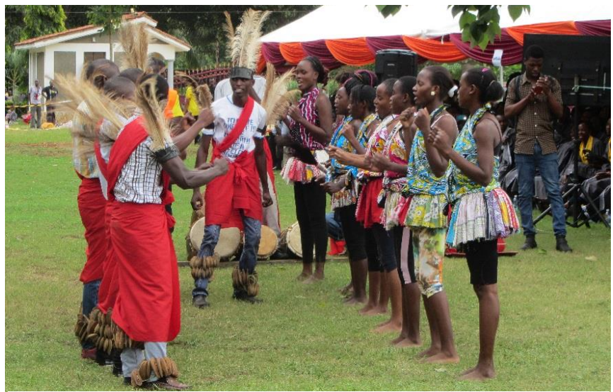
Natuurlijk ook muziek, dans, zang en poëzie tijdens het afstuderen!