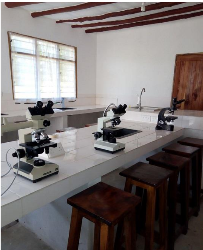
The almost ready laboratory with some of the acquired microscopes

Eind 2016 kregen we steun van Stichting Wanawa, Stichting OntwikkelingsSamenwerking De Ronde Venen en Wilde Ganzen om het Community Health and Education Center (CHEC) af te werken en in te richten. In 2017 is dit grotendeels gebeurd. De bedoeling was dat het geheel klaar zou zijn rond september 2017 maar door allerlei factoren werd dat niet gered. Met kerst was echter het grootste deel van het project afgerond en rest alleen nog de aanschaf van medische uitrusting om bepaalde laboratoriumtests af te nemen. In het eerste kwartaal van 2018 zal dit ook gedaan zijn. Doel van het project is om te zorgen dat zwangere vrouwen uit de omgeving gemakkelijk toegang hebben tot standaardtests om mogelijke zwangerschap-gerelateerde problemen vroeg te herkennen. Bovendien willen we ook helpen de zorg voor chronische ziekten te verbeteren. Het laboratorium is in staat bepaalde testen aan te bieden en daarnaast werd dit jaar een project met de lokale overheidskliniek opgestart om met behulp van Rotary dokters uit Nederland de zorg voor suikerziekte en hoge bloeddruk te verbeteren.