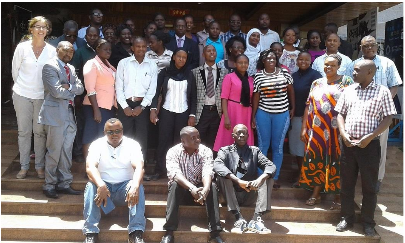
Groep Clinical Officers Reproductive Health tijdens de presentatie van de onderzoeksresultaten

Tenslotte zijn we sinds 2014 bezig met onderzoeksactiviteiten op het vlak van op het vlak van personeel in de gezondheidszorg, reproductieve gezondheidszorg en diverse aspecten van gezondheid op gemeenschapsniveau. Nadat de resultaten van ons eerste onderzoek waren meegenomen in een beleidsdocument voor diverse Oost- en Zuid-Afrikaanse landen, hebben we in november de resultaten van het tweede onderzoek verwerkt in een artikel waarvan we hopen dat het in de loop van 2018 gepubliceerd zal worden. Bovendien kregen we goedkeuring voor de financiering van vier kleine lokale onderzoeksprojecten in een naburige regio. In 2018 zullen we deze onderzoeken uitvoeren en kijken we ook uit naar meer samenwerking met andere organisaties en Kilifi County op dit vlak.