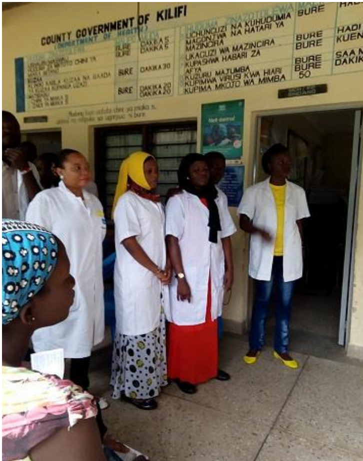
North Coast MTC studenten gereed om te helpen tijdens de "zwangerschapszorgdag"

en hun partners waarbij allerhande informatiesessies werden gehouden (over zwangerschap, bevalling, de periode na de bevalling, herkennen van (seksuele) mishandeling bij kinderen, contraceptie) en waar de baby's en de zwangere vrouwen werden getest. De dag werd enorm gewaardeerd, ook al omdat veel vrouwen al ver in de zwangerschap waren maar door de sluiting van de overheidsvoorzieningen nog geen enkele controle hadden ondergaan. We gaan kijken hoe we in de toekomst verder kunnen bouwen aan een betere zorg voor moeder en kind in het gezondheidscentrum en verbetering van de kennis over menstruatie, seks, zwangerschap en voorbehoedmiddelen in de algemene bevolking en specifiek onder de jongeren.