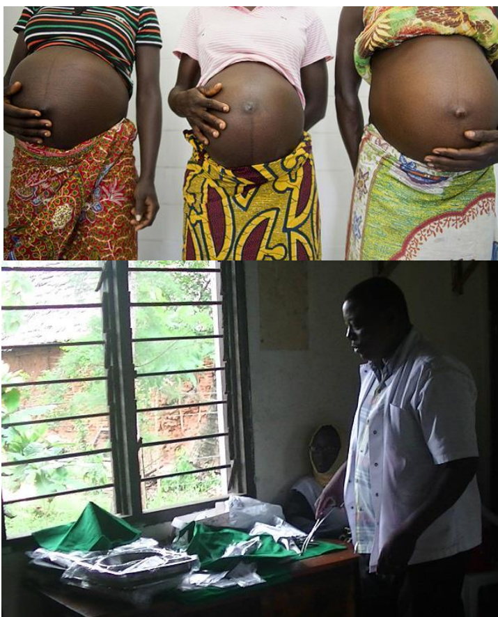
Uitreiking van een aantal van de bevallingssets aan de kliniek in Bomani

In 2017 hielden we een inzamelingsactie om het tekort aan bevallingsmaterialen in de overheidsziekenhuizen waar North Coast MTC mee samenwerkt te verminderen. In de ziekenhuizen in Kilifi, Malindi en Mariakani bevallen gemiddeld bijna 40 vrouwen per dag en er was een groot tekort in de hoeveelheid medische middelen om bij de bevallingen te assisteren en infecties en andere problematiek te voorkomen. Dankzij de gulle bijdragen van Stichting Voeten in de Aarde en Stichting OntwikkelingsSamenwerking De Ronde Venen werd dit project een groot succes! In totaal zijn er, in overleg met de ziekenhuizen, 26 basis sets voor bevallingen, 12 sets met extra materialen (bijvoorbeeld as er gehecht moet worden etc.), en een aantal begeleidende materialen (uitzuigers, weegschalen, waterafstotende schorten etc.) gedoneerd aan de drie ziekenhuizen en aan twee kleinere gezondheidscentra.